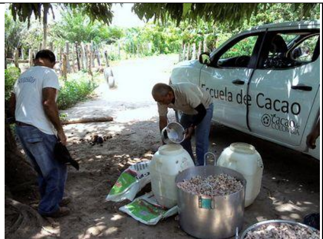
El negociante transfiera la baba a tanques plásticos

Sacan el peso de cada tanque con una escala de resistencia. Cada tanque pesa alrededor de 42 kilos cuando lleno y tres kilos cuando vacío. En este caso tenían casi un tanque y medio de la buena baba y un tanque y medio de la variedad 51.