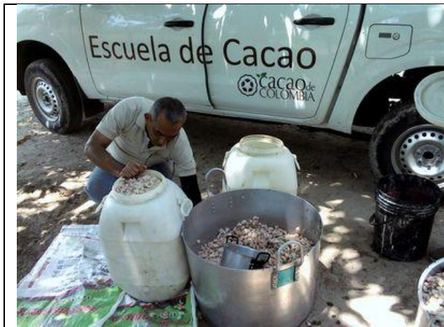
Dividen calidades de cacao en tanques diferentes

El proceso de transferir babas es complicado con la condición sanitario. No quieren botar las babas en el suelo y usan sacos para reducir contaminación. Un cucharón y un embudo grande de plástico ayudarían mucho. La ventaja de no traer un embudo o cucharón es que no tienen que limpiar estas herramientas.