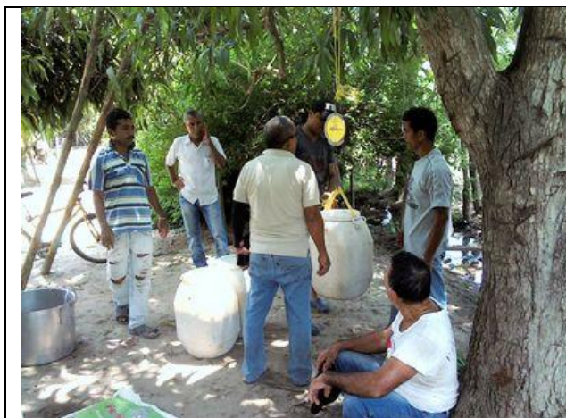
Pesan los tanques para valorar el producto

Sacan el peso de cada tanque con una escala de resistencia. Cada tanque pesa alrededor de 42 kilos cuando lleno y tres kilos cuando vacío. En este caso tenían casi un tanque y medio de la buena baba y un tanque y medio de la variedad 51.