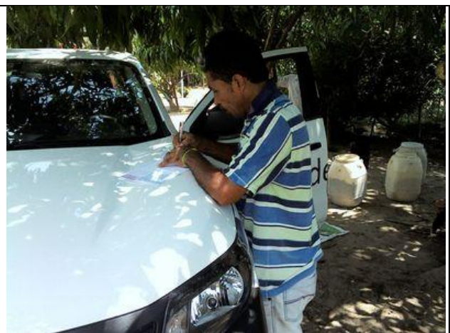
Mantienen documentos de las ventas

Confirmaron la pesa y valor de la baba y firmaron los resultados. El negociante fue atracado una vez en esta región y ahorra no carga dinero. Cuando regresa al centro, la compañía transfiere el pago electrónico a la cuenta de ahorros del agricultor.